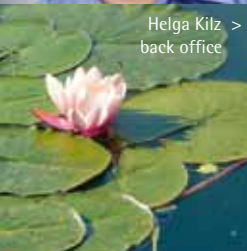
Helga Kitz > back office