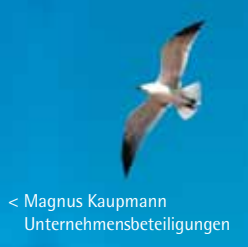
< Magnus Kaupmann Unternehmensbeteiligungen